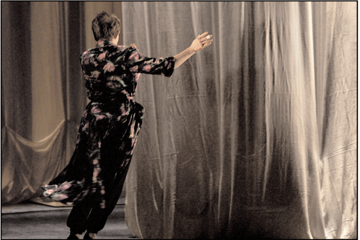
ALICE OU LE MONDE DES MERVEILLES