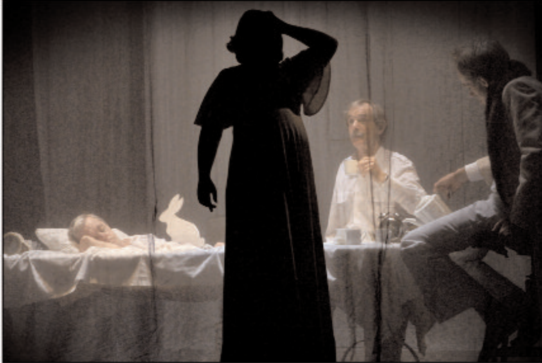
ALICE OU LE MONDE DES MERVEILLES