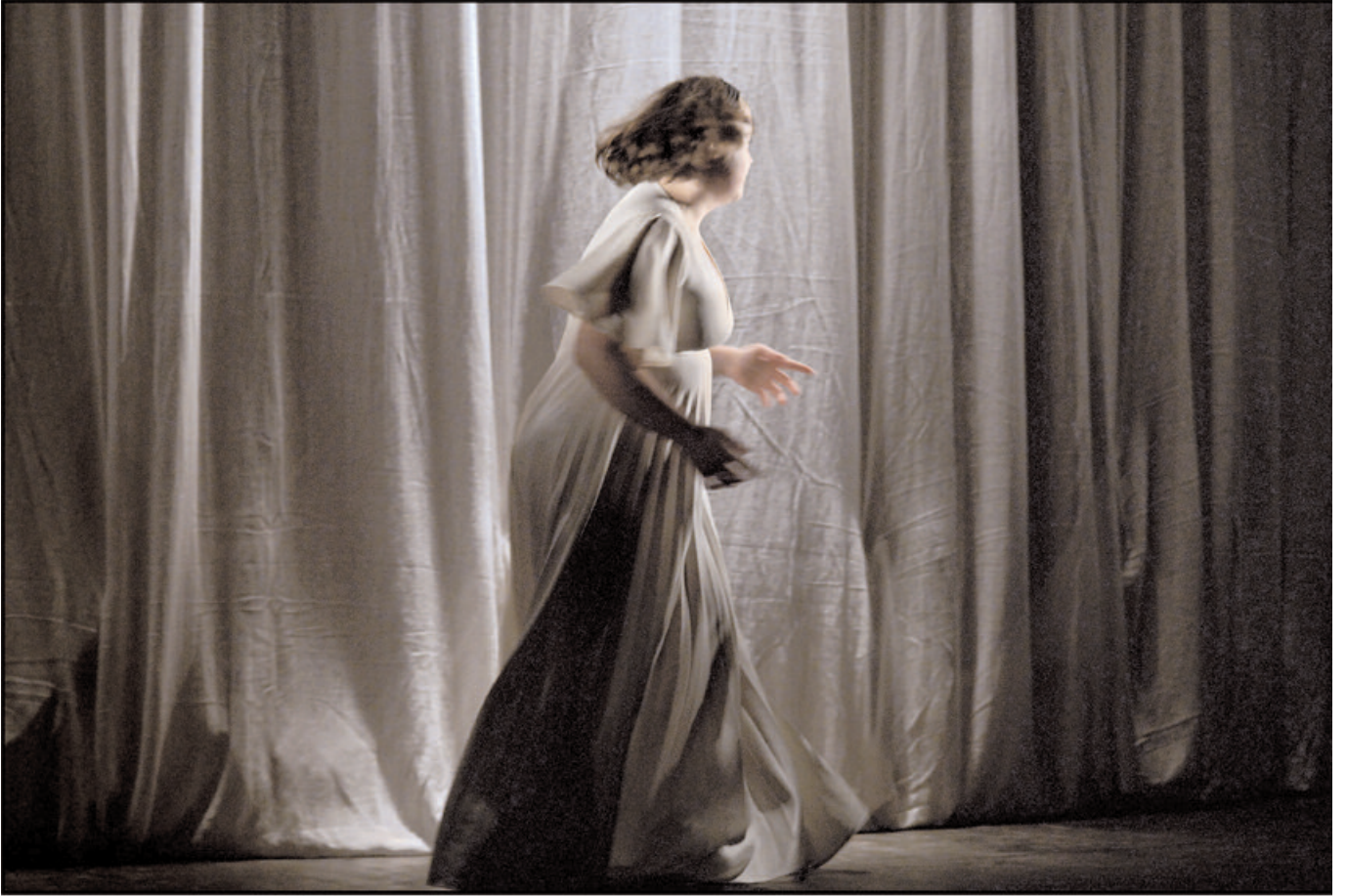
ALICE OU LE MONDE DES MERVEILLES