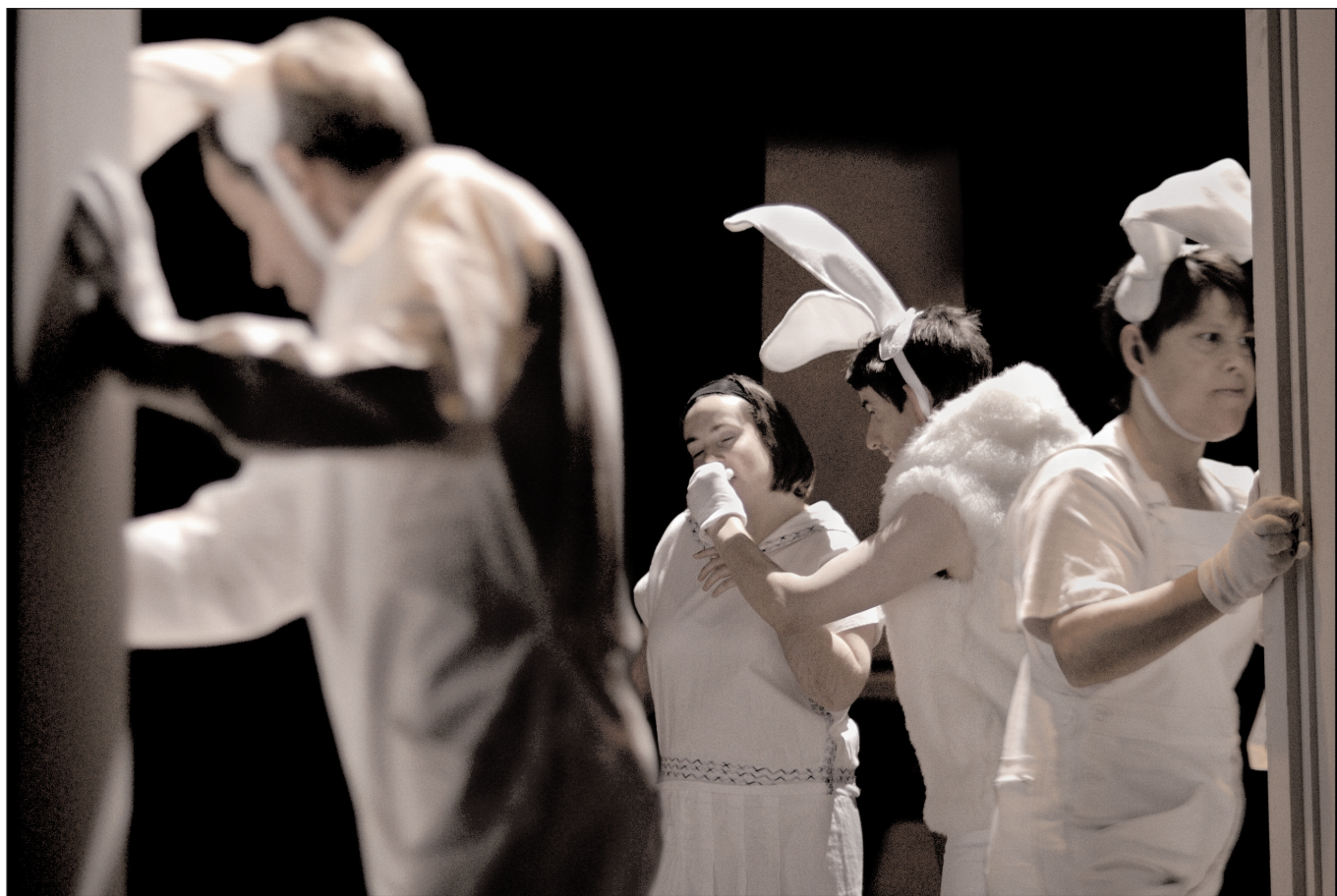
ALICE OU LE MONDE DES MERVEILLES