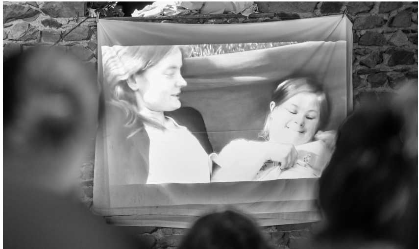
Photos issues de répétitions, Le Vivat( Armentières) et du Festival Dix dans un Pré (Claveissolles)