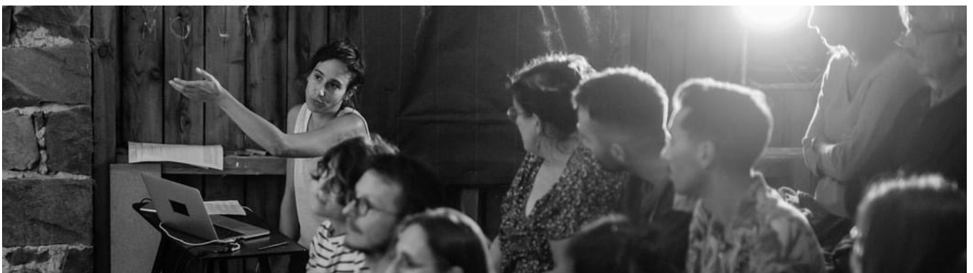
Photos réalisées lors du Festival Dix dans un pré, Claveissolles (création d'une petite forme intermédiaire)

La Mouche, Saint Genis Laval / 1 représentation