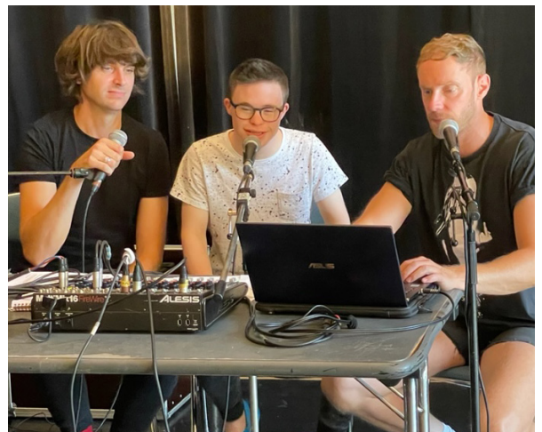
Résidence au Vivat (Armentières)