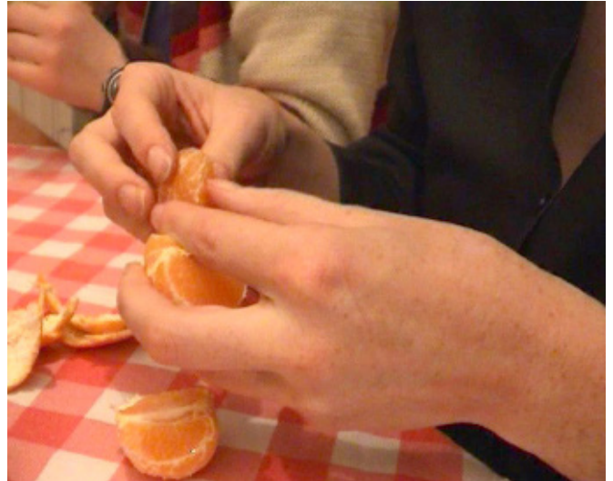
Documentaire inachevé «Territoire des soeurs», Joffrey Dieumegard et Rebecca Hargreaves